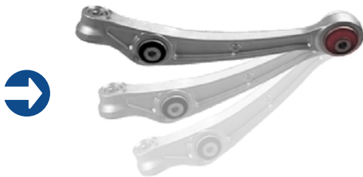
Beweging van de draagarmen bij het naar beneden laten van het voertuig.