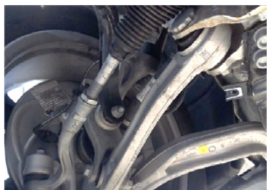
Vastzetten van draagarmen met "hangende" wielen (tekening A)

Deze extra spanning kan leiden tot vroegtijdige slijtage van de rubbers in de draagarmen.