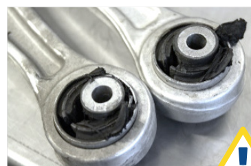
Vroegtijdige slijtage van de draagarmrubbers.

Om te strak aandraaien te voorkomen, beperk je het eerste aantrekkoppel tot een minimale waarde waarbij de draagarmrubbers op hun normale positie komen te zitten. Zodra het voertuig volledig in neutrale positie is, kan het definitieve aantrekkoppel worden uitgevoerd.